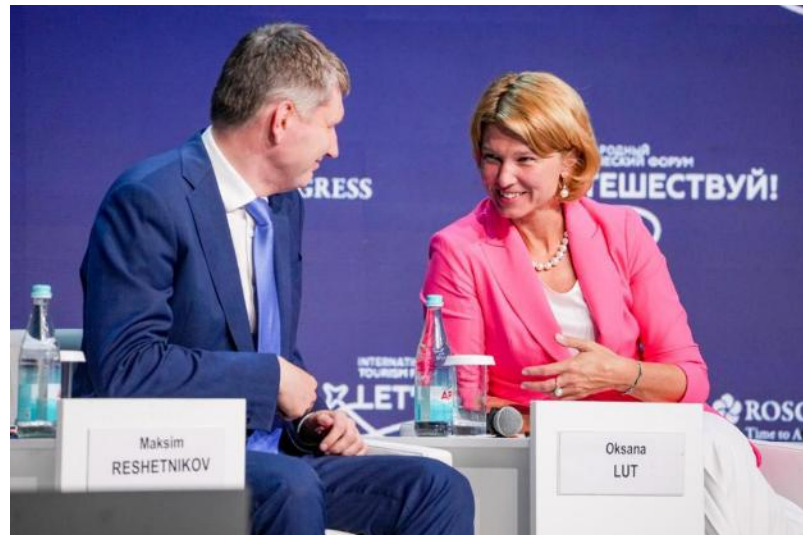
Форум «Путешествуй!», сессия «Эффективное развитие сельского туризма: потенциал сельских территорий и малых городов»

Октябрь, Москва Выставка «Золотая осень» Конференция по развитию сельского туризма