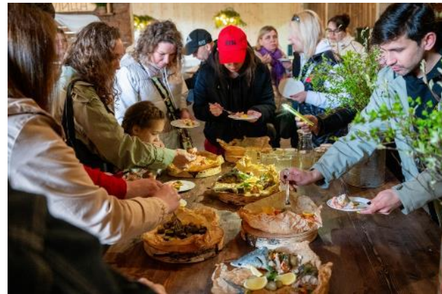
«Гусиная столица» (Костромская область)

«Чаше всего опрошенные предпочли бы продегустировать фермерские продукты (83%); познакомиться с историей края, местными традициями (81%), купить фермерские продукты (72%)».