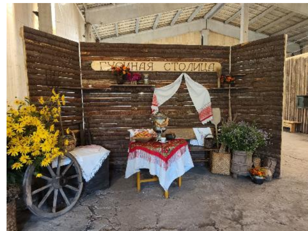
«Гусиная столица» (Костромская область)

что-то особенное, связанное с местом (история, предмет, деталь, камень)