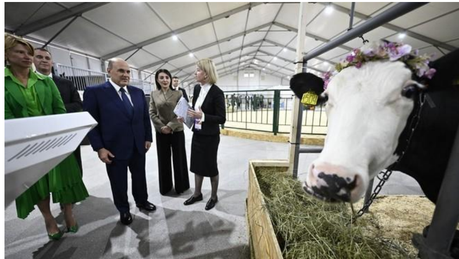
Выставка «Золотая осень», сайт Правительства России