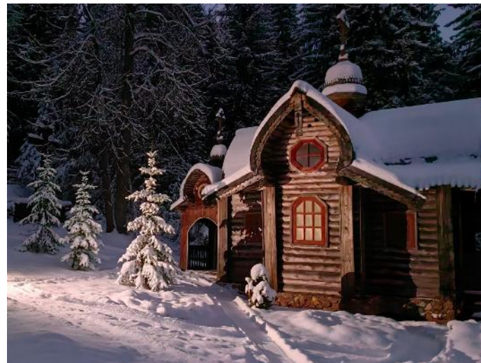
«Давыдовская мельница», Ярославская область